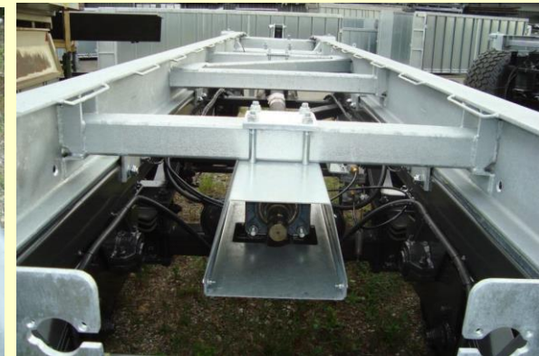
Propulsione tramite cardano