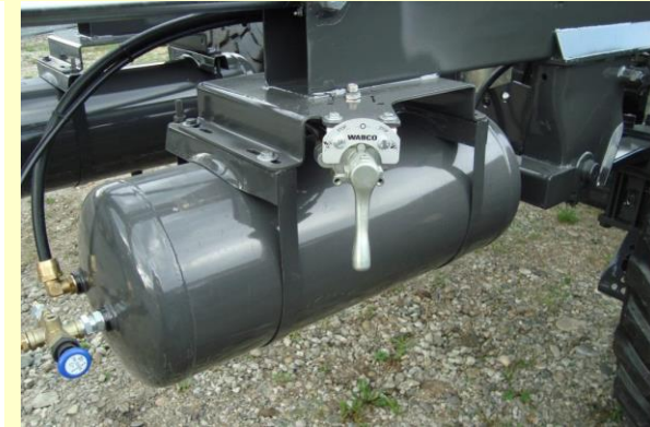
Amorizzatori ad aria