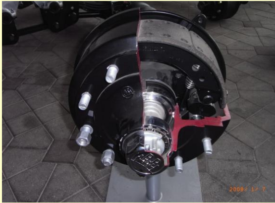
Tamburi 410 x 120 o 180mm