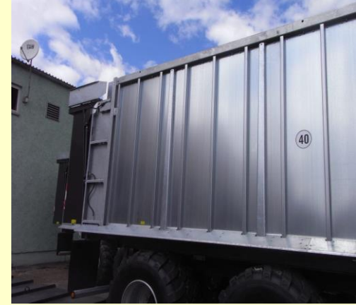
Pareti laterale di materiale leggera