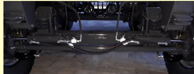
L'asse sterzo sforzata BPW