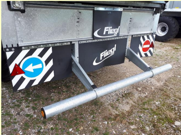
Sbarra di sicurezza posteriore fissa, manuale, idraulico