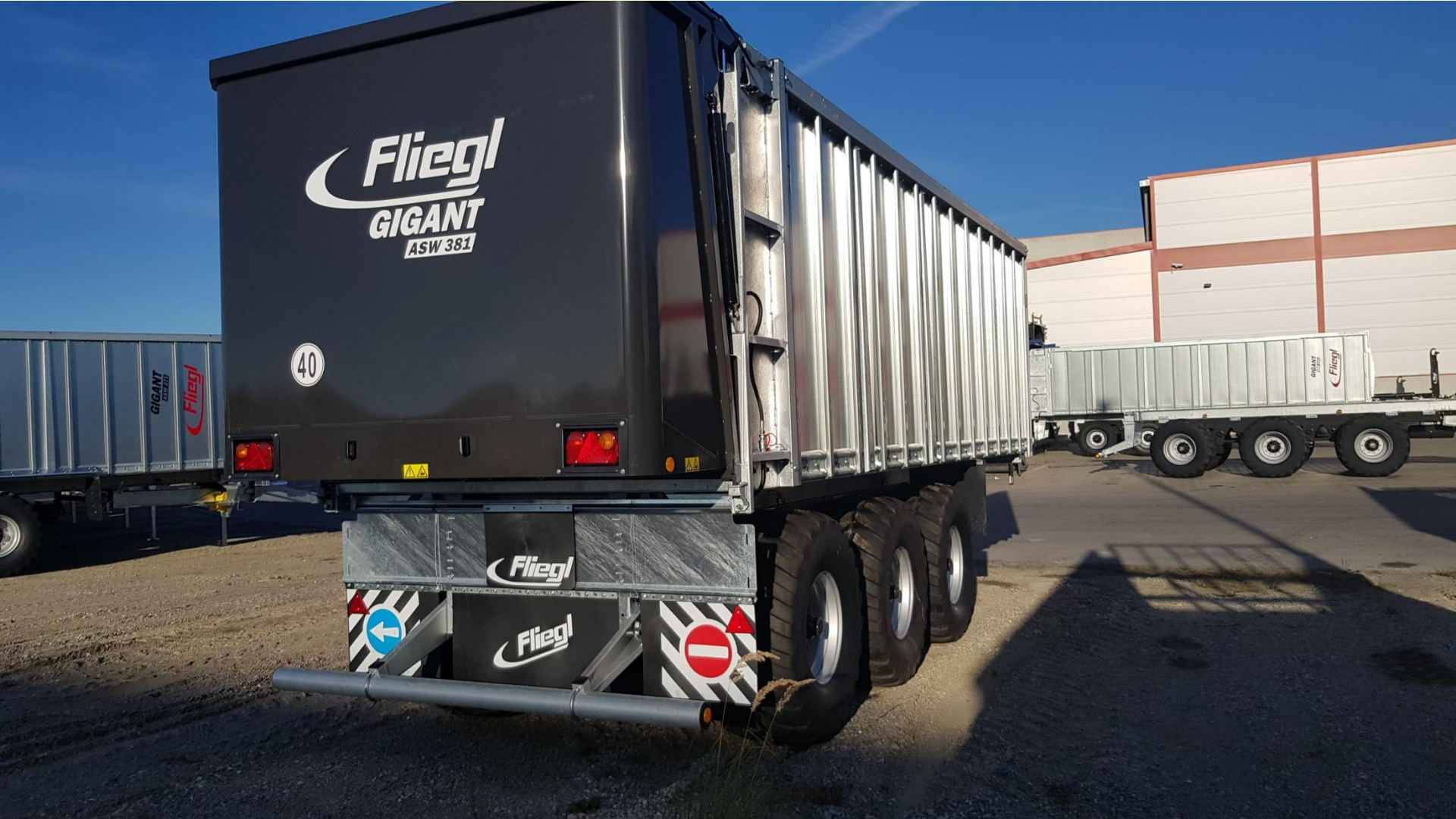
SAN-HELL HEIZOMAT ITALIA 2019