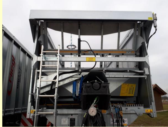
Visuale libera al interno